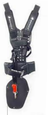
Arnés acolchado profesional